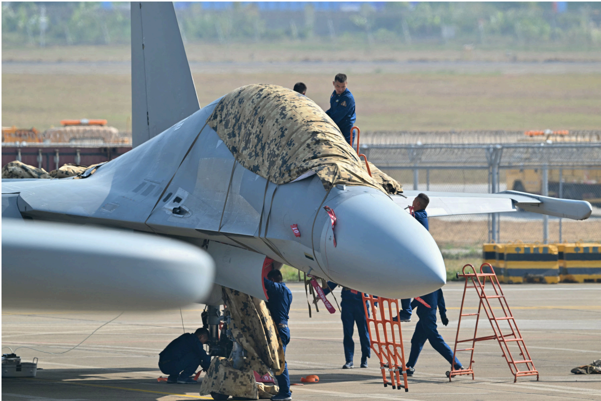
2024年11月12日，珠海航空展上尚未揭掉护罩的中共歼-16战斗机。