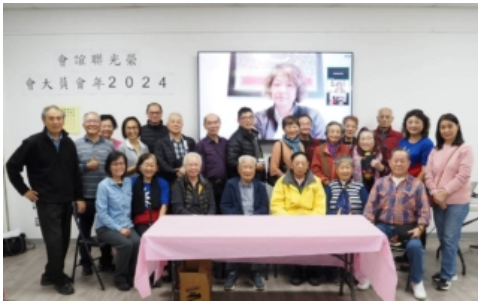
多伦多荣光联谊会选举第22届理监事