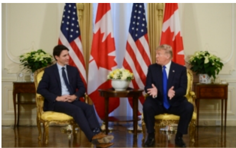
分析：川普当选对加拿大几大领域的影响