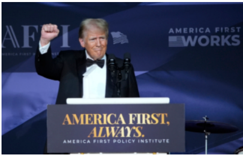
夏林：川普胜选 对美国加拿大及中国经济的影响