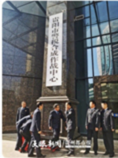
贵州首个“警税合成作战中心”