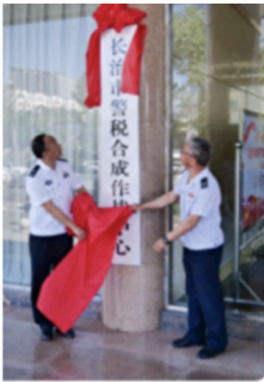
全国第一家!山西首家“警税合成作战中心”揭牌