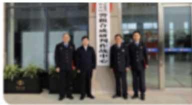
国家税务总局驻马店市税务局官方网站