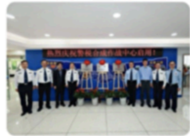
打击涉税违法犯罪,深圳警税合成作战中心正式揭牌