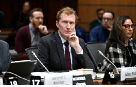
加拿大将大改移民系统 针对难民和雇主担保