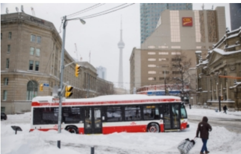
加拿大冬季天气预报：暖冬今年不会重演