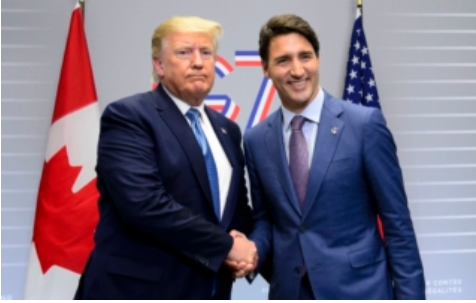
夏林：特鲁多面见特朗普 皆大欢喜