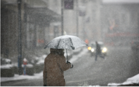
安省南部本周将迎来降雪 居民做好准备