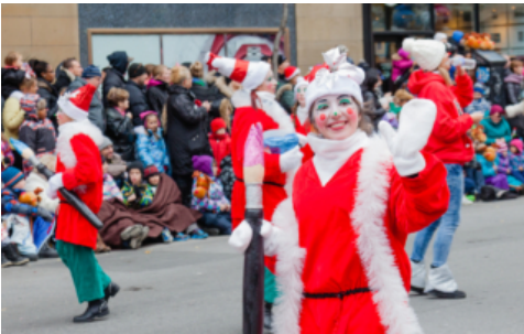
感受圣诞气氛 观看大多伦多地区圣诞节游行