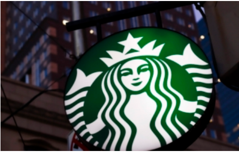
星巴克在加拿大推出全新独家假日饮品