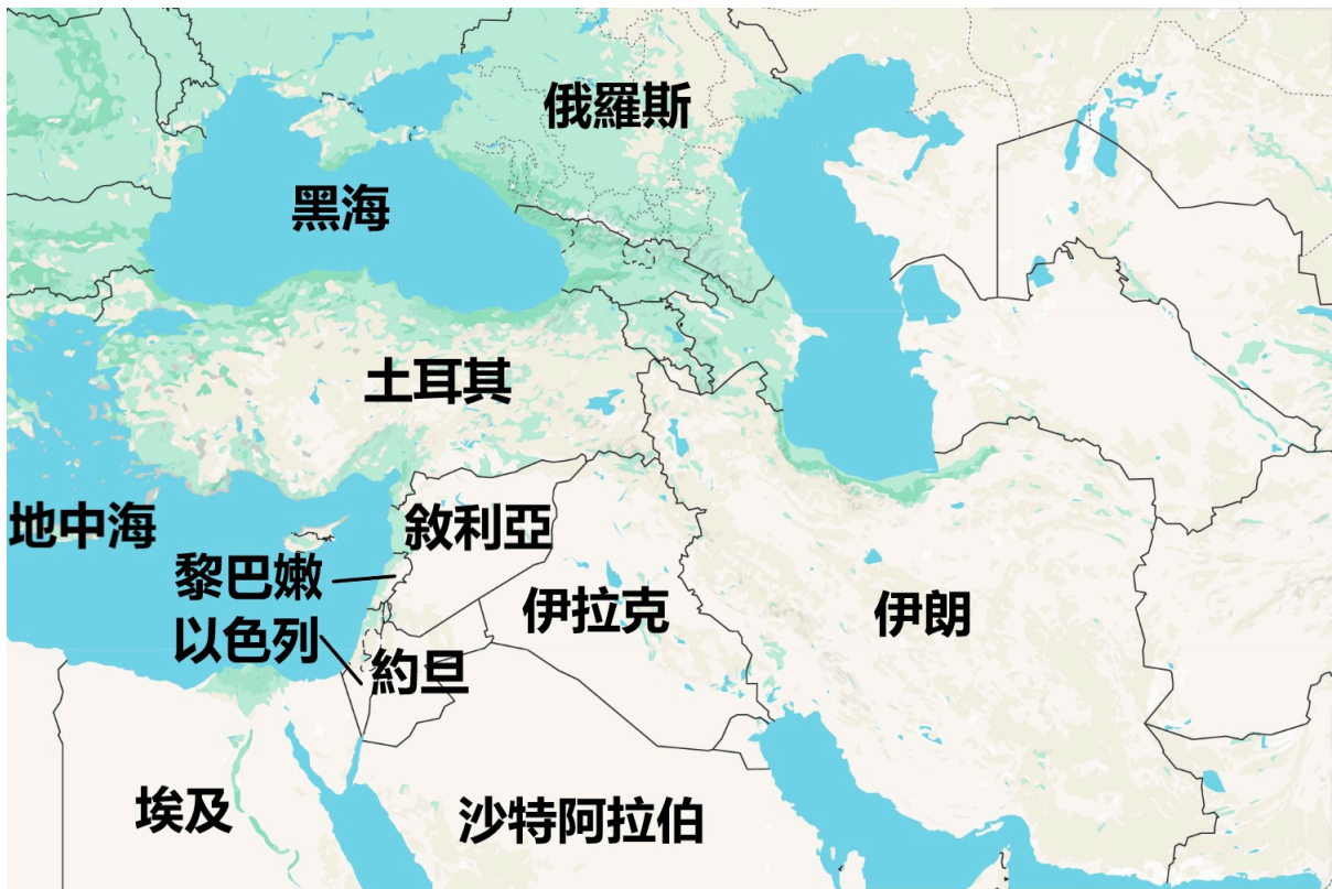
叙利亚周边国家地图。（谷歌地图）