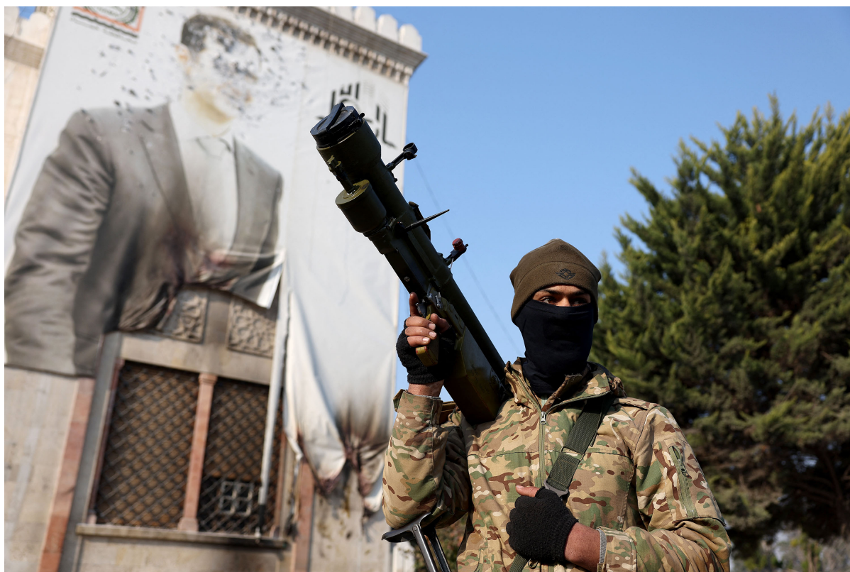
2024年12月6日，叙利亚反政府武装占领中部城市哈马后，一名武装人员手持武器站在阿萨德被污损的肖像前。

川普一席话，基本上勾勒出了叙利亚内战逆转的关键原因，失去了外部强力支持的阿萨德政权难以再和反政府武装对峙，大多数政府军不打算再为阿萨德家族卖命，很快四散奔逃了。