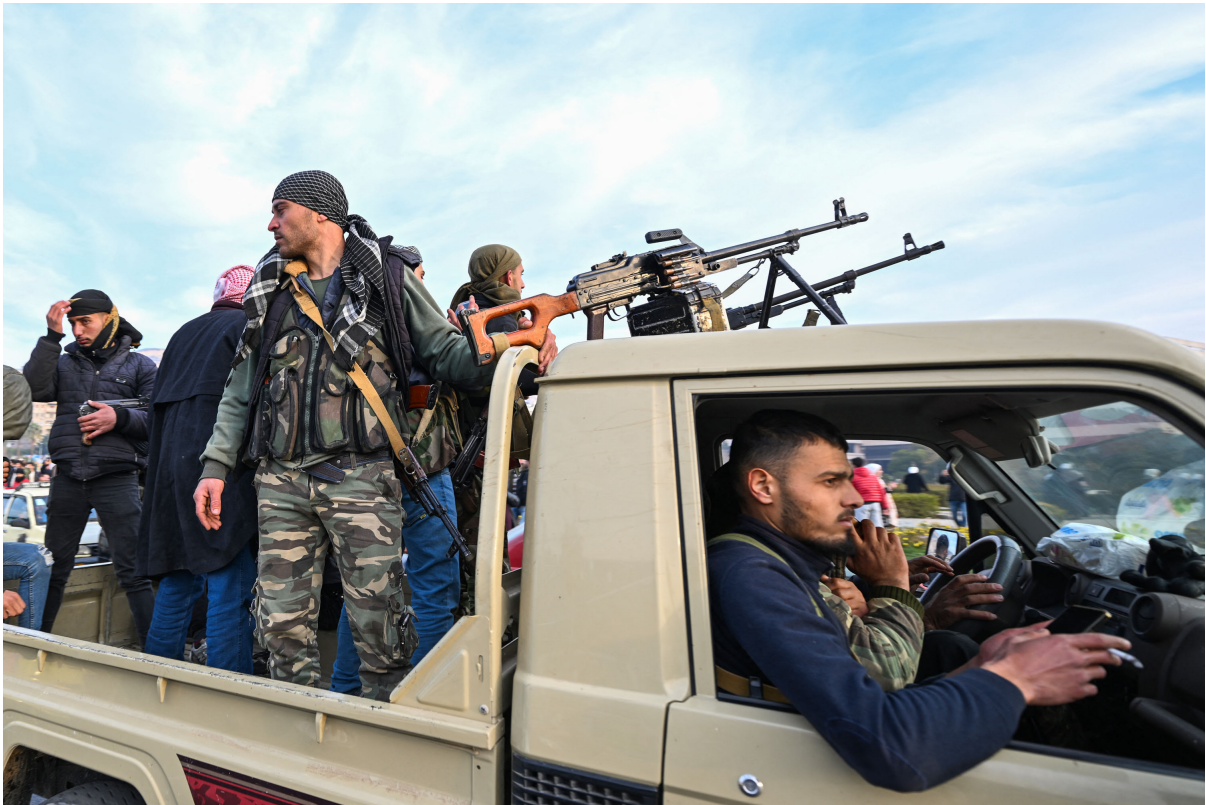
2024年12月8日，叙利亚反政府武装人员乘车抵达首都大马士革倭马亚广场。