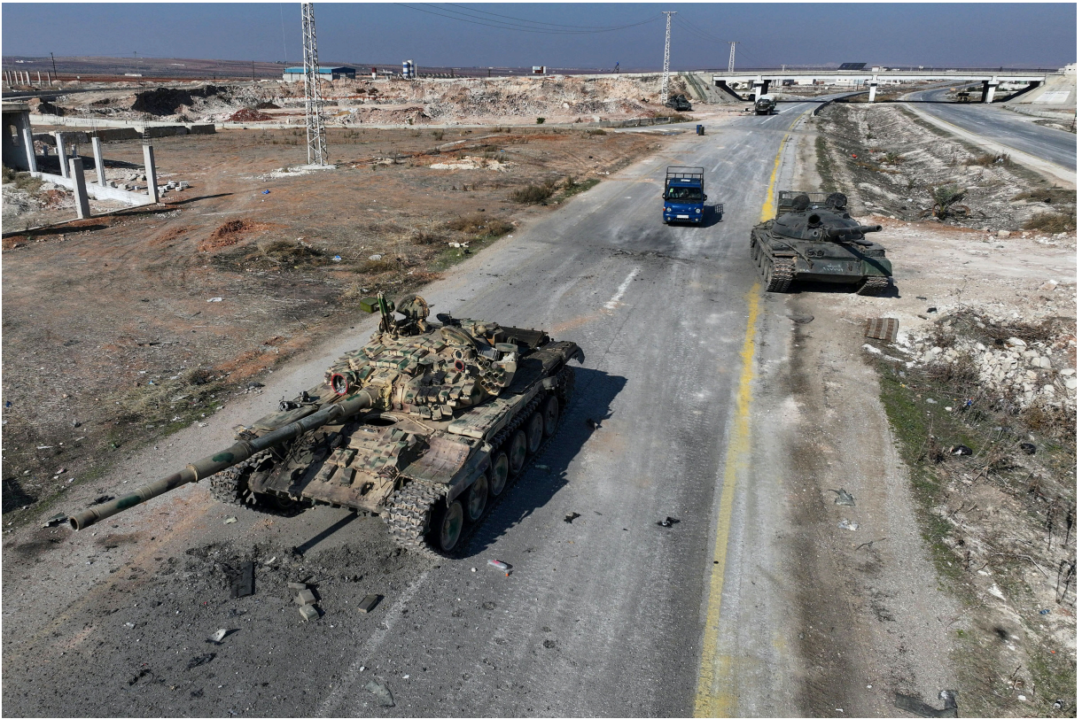
2024年12月3日，叙利亚政府军的坦克被遗弃在通往首都大马士革的公路上。

叙利亚内战与俄乌战争、以哈和以巴战争直接相关；出人意料的逆转，是另外两个战场不断发展带来的另一种结果。