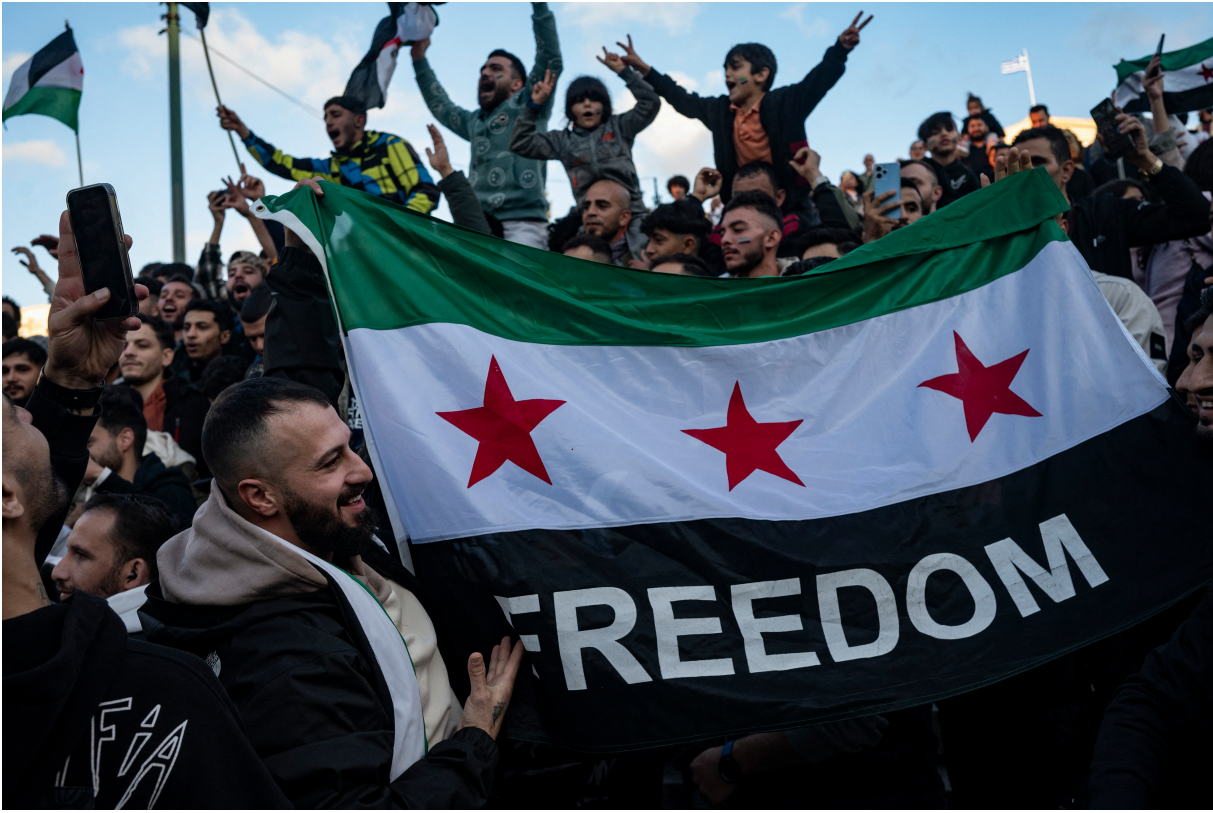
2024年12月8日，示威者在大马士革街头举着叙利亚反政府组织的旗帜，庆祝独裁者阿萨德政权终结。

12月8日，反政府武装占领首都大马士革后，宣布了宵禁，各界呼吁政权和平过渡，但各武装组织是否真能达成妥协、战事是否就此平息，尚需观察。