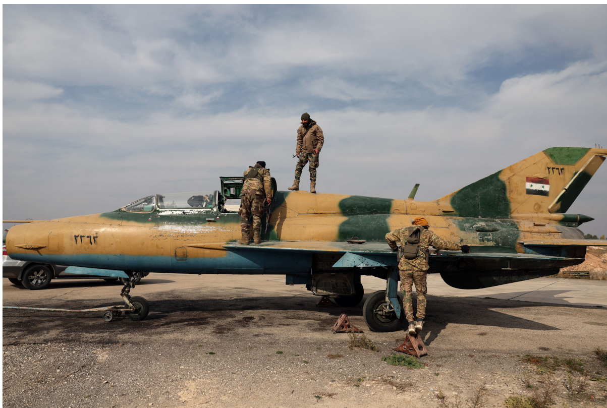
2024年12月6日，叙利亚反政府武装占领了中部城市哈马附近的一个空军基地，缴获了政府军的战斗机。

似乎没有展现能力，部分也被反政府武装缴获了。叙利亚政府军的火炮好像也没有多少真正打响；短程导弹库存不少，但恐怕没人愿意操作。