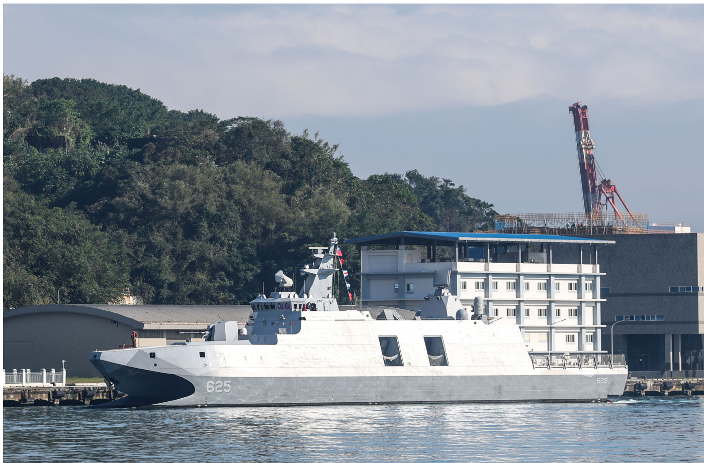
2024年12月11日，台湾基隆港内停靠的沱江级导弹快艇。

中共小型战舰航速慢，很可能有去无回；船员们应该心知肚明，实战中要想保命的话，出了第一岛链最好赶紧挂上白旗，或者通过宫古海峡时就用无线电公开喊话投降，否则一旦接战就会葬身海底。