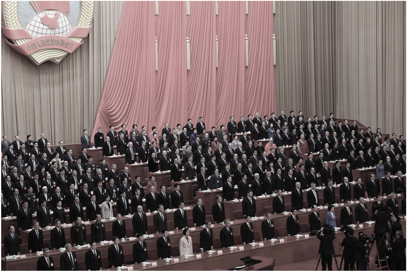
2024年3月4日，中共政协会议主席台上的中共高官。