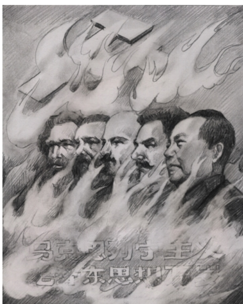
Các-mác, Ăng-ghen, Lê-nin, Xta-lin, và Mao Trạch Đông

Năm 1840, theo các sử gia nhìn nhận, là mốc đánh dấu điểm bắt đầu của lịch sử Trung Quốc cận đại, cũng là chuyển từ một Trung Quốc cổ đại sang một Trung Quốc hiện đại. Từ bấy giờ, nền văn