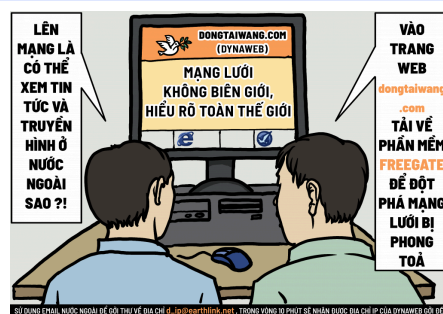
Lướt Web an toàn với Freegate