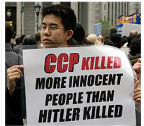
Lịch sử đẫm máu của ĐCSTQ

Cuộc bức hại Pháp Luân Công ở Trung Quốc đã bước sang năm thứ 20, chúng ta hãy cùng nhìn lại quá trình Pháp Luân Công đã mang lại lợi ích cho xã hội, cũng như cuộc bức hại tàn khốc đối với các học viên. Báo cáo này dựa trên những bằng chứng của nhân chứng trực tiếp do trang web Minh Huệ thu thập được trong hai thập kỷ qua.